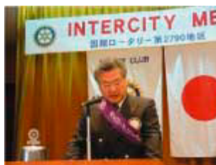
富一美会員の発表