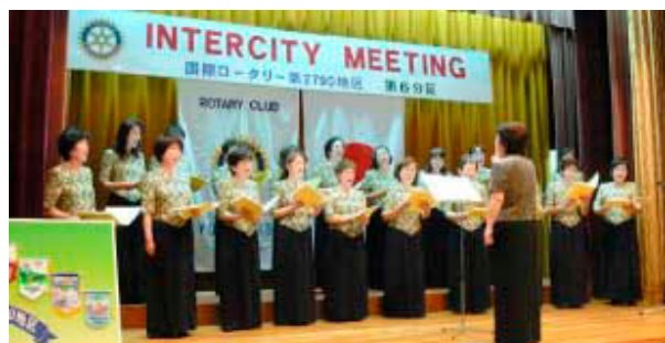
コーラス(ポーチェフローラ)の皆様