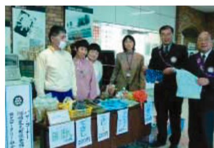
福祉作業所の生徒さん達と会員