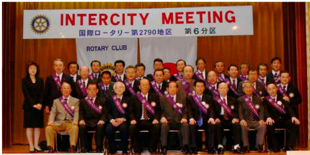
2006~07 IMホストクラブ 横芝RCメンバー