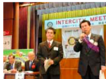
秋葉次年度がくた補佐/管井がくた補佐