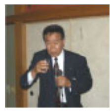
乾杯 向後雅生会員