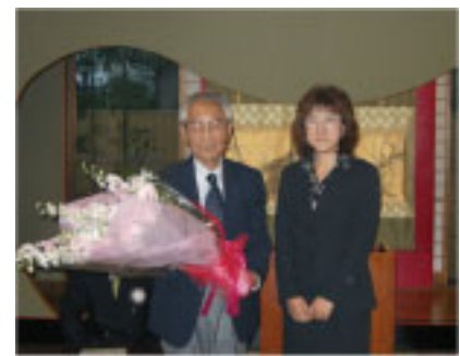
小室会員, 35年間有難うございました。