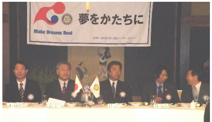
成田空港南RC, 東金RC会長幹事