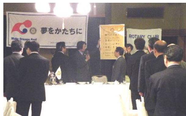
東金RC市東幹事による「四つのテスト」