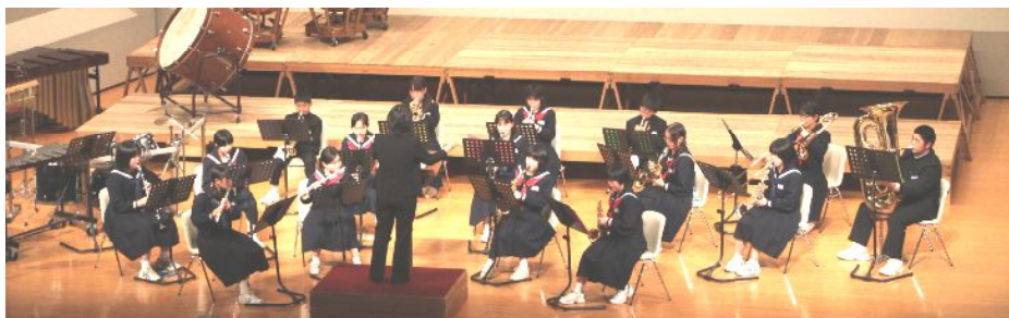
～山武市立成東中学校吹奏楽部～