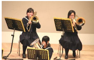
～山武市立松尾中学校吹奏楽部～