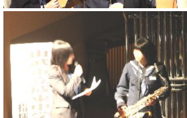
～山武市立成東東中学校吹奏楽部～