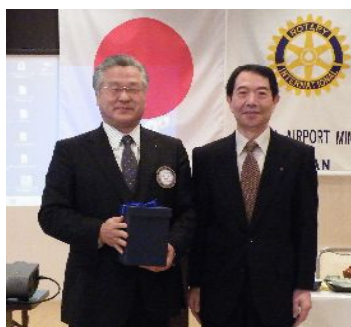
「誕生祝」 富一美会員 (2月)

みなさんこんにちは。3月になりましたがいまだに寒い日が続いております。風邪などに十分注意して頂きたいと思います。