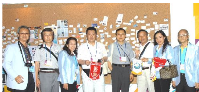
バナー交換ブース