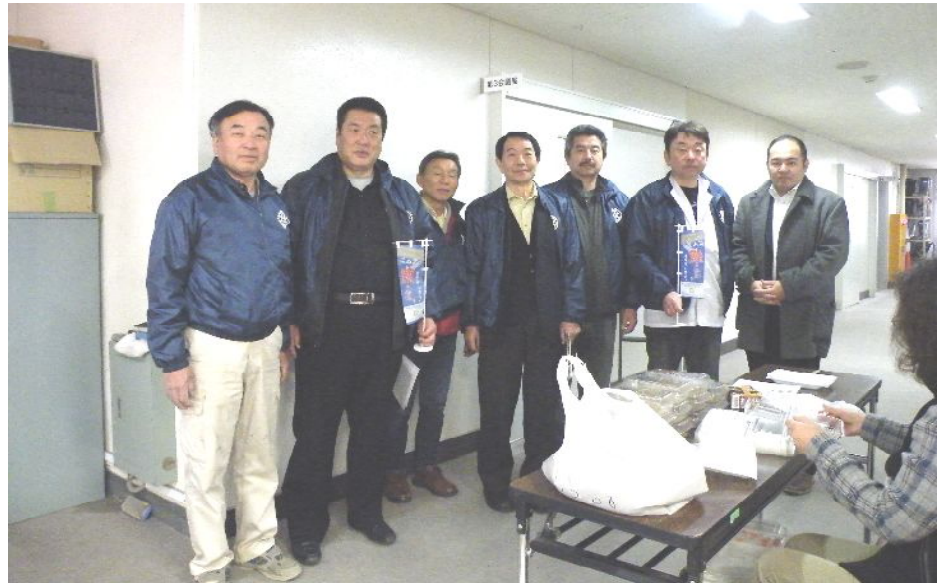
サケの受精卵配布の準備中