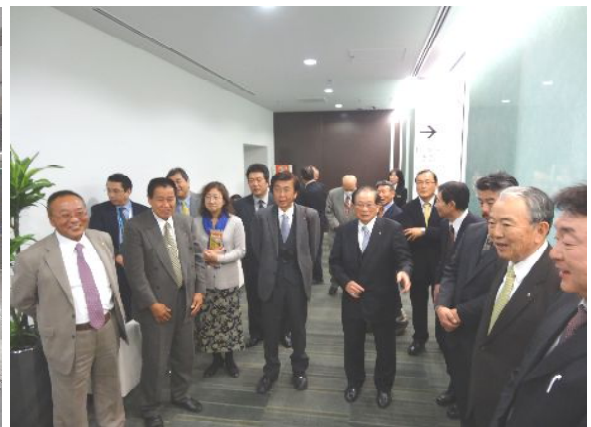
ビジネスアビエーションターミナル