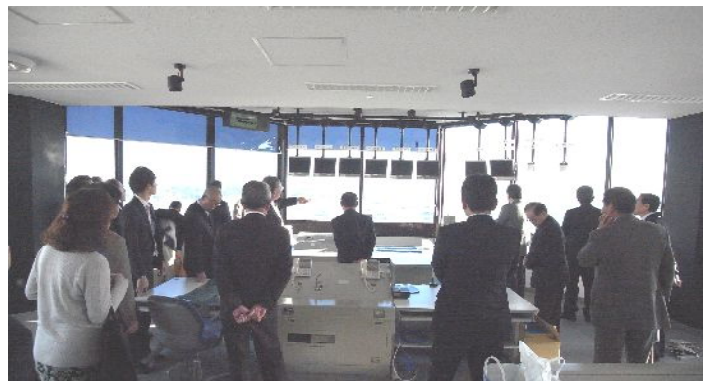
ランプコントロールタワー 13階