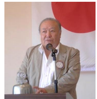
R情報(兼 クラブ研修)委員会