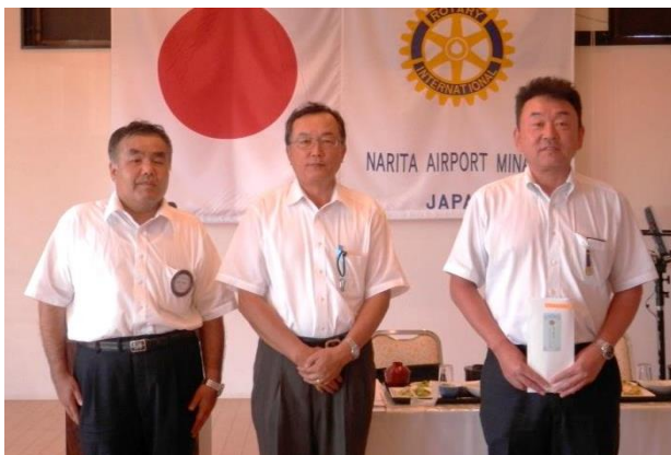
市原会員 / 行木会長 / 古西会員