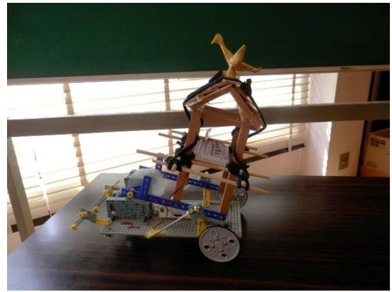
鬼来迎をモデルにした電動おみこし