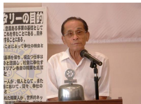
八咫少年少女発明クラブ