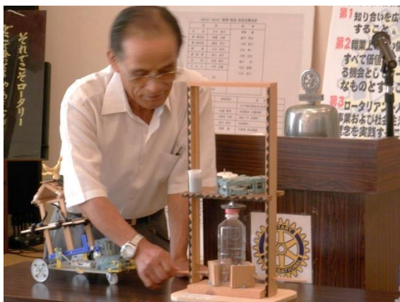
ペットボトルの蓋の開け閉めができる