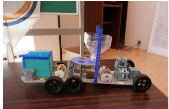
種蒔き機（6年生の作品）