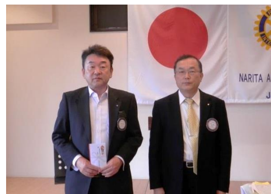
古西会員 / 行木会長