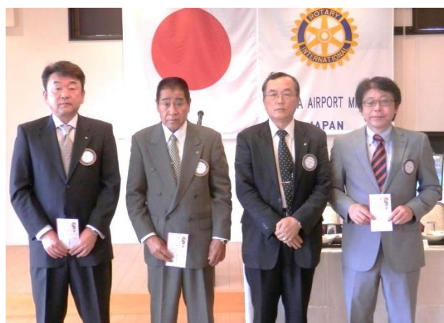
古西会員 / 向後会員 / 行木会員 / 伊藤会員