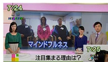
NHK「おはよう日本」2014/11/6放送 「注目集まるマインドフルネス」