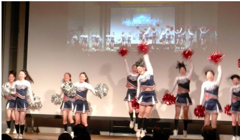
植草学園高校バトント部と バトントリング部のコラボパフォーマンス