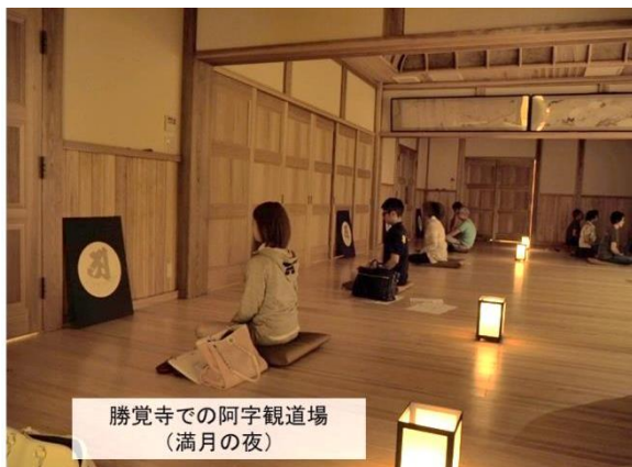
勝覚寺での阿字観道場 (満月の夜)