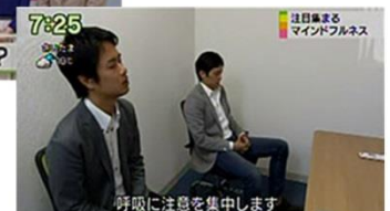
注目集まるマインドフルネス