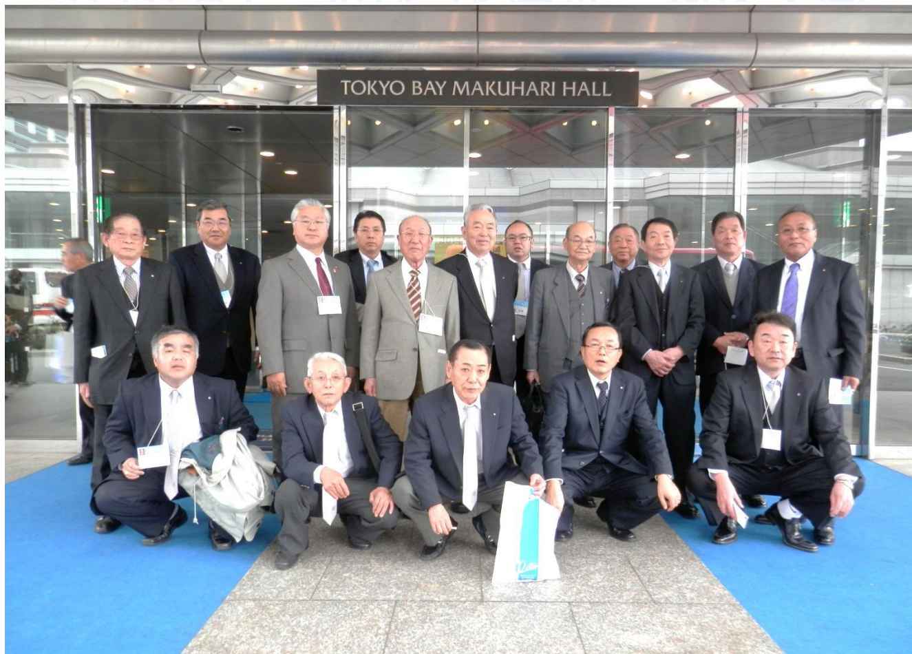
アパ&リゾート東京ベイ幕張